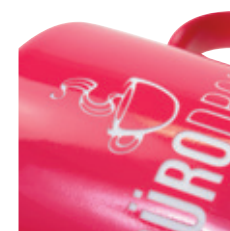
Reliefgravur auf farbigem Untergrund