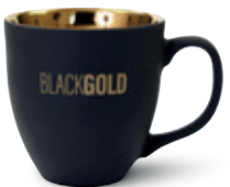
Hydroglasur - Smooth Touch