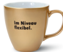
Hydroglasur Metallic (mit Xpressiondruck)