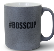
Betnoptik (mit Reliefgravur)