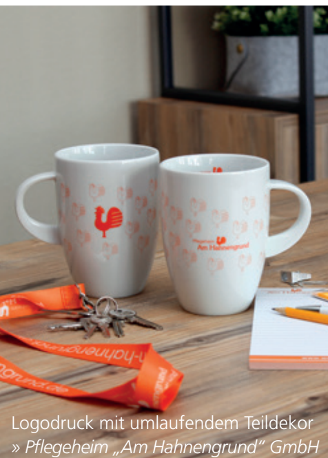
Logodruck mit umlaufendem Teildekor » Pflegeheim „Am Hahnengrund“ GmbH