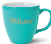
Hydroglasur (mit Goldmetallic- Xpressiondruck)

Farblich passend zur Gestaltung des Artikels kann z.B. der Mundrand mit einer handgemalten Linie oder Band veredelt werden.