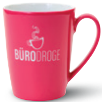
Hydroglasur (mit Reliefgravur)