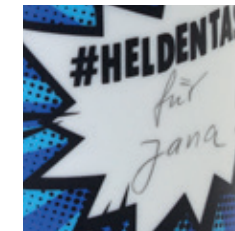
Notiz - Individuell