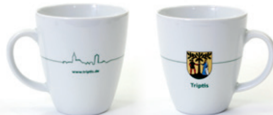
vollflächiger Fotodruck umlaufend inkl. Logo » Stadt Triptis