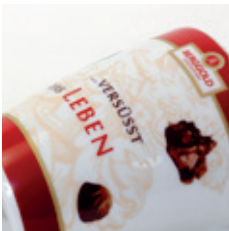
Fotorealistische Motive in Kombination mit Schrift