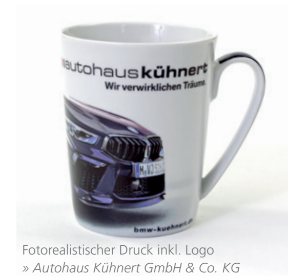
Fotorealistischer Druck inkl. Logo » Autohaus Kühnert GmbH & Co. KG