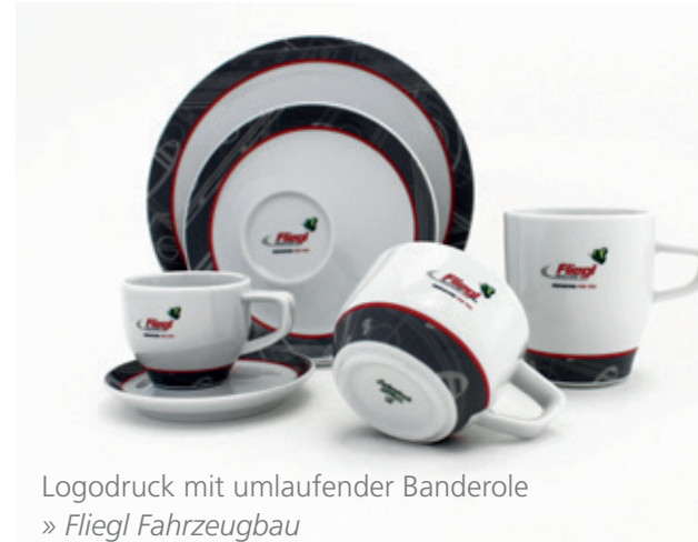
Logodruck mit umlaufender Bänderole » Fliegl Fahrzeugbau