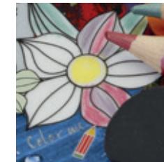
Notiz - Scribbles

Das Porzellan als Notizzettel oder individueller Botschaften-Bringer? - Mit der beschreibbaren Oberfläche kein Problem. Mit Bleistift oder Buntstift beschreibbar & radierbar.