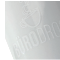
Relief-Druck in weiß

Mit Gravur- oder Drucktechniken können verschiedene Reliefs auf der Porzellanoberfläche erzeugt werden. Diese können dabei sehr dezent und elegant wirken oder farbig hinterlegt das CI extravagant präsentieren.