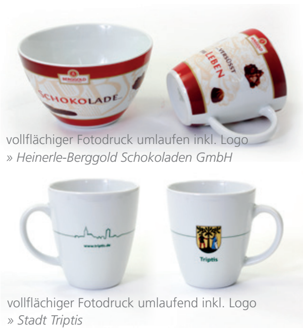
vollflächiger Fotodruck umlaufen inkl. Logo » Heinerle-Berggold Schokoladen GmbH