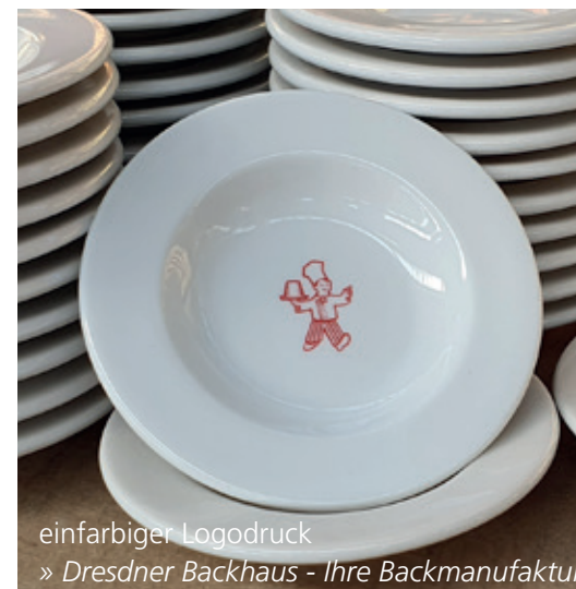
einfarbiger Logodruck » Dresdner Backhaus - Ihre Backmanufaktur