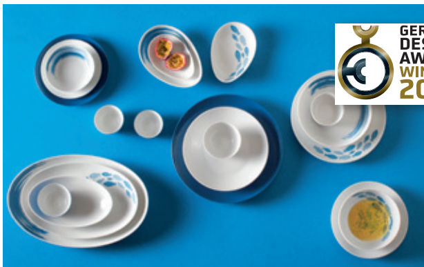
Geschirrsreihe SIMPLY COUP