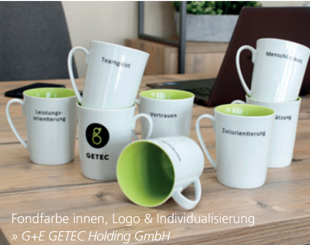
Fondfarbe innen, Logo & Individualisierung » G+E GETEC Holding GmbH