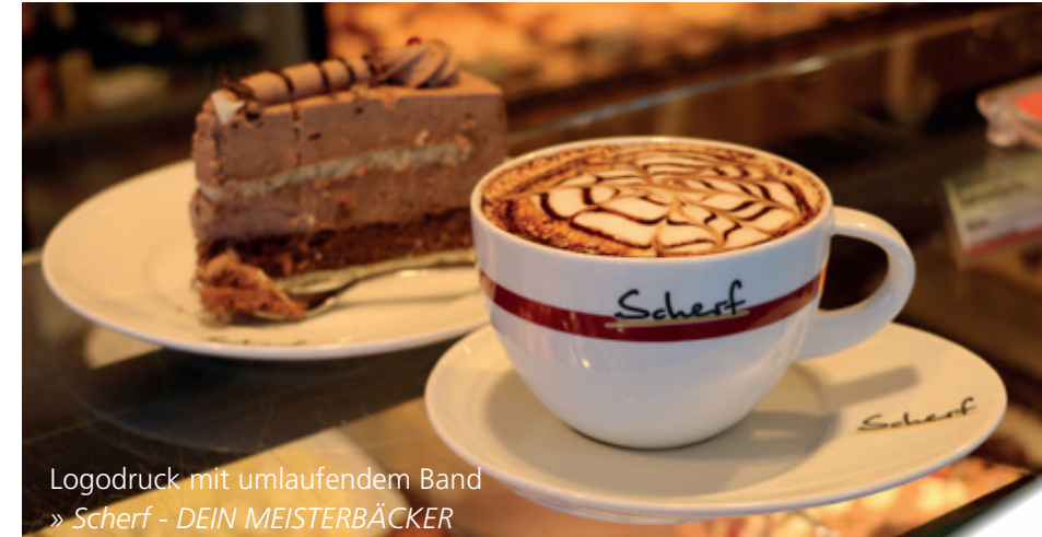
Logodruck mit umlaufendem Band » Scherf - DEIN MEISTERBÄCKER